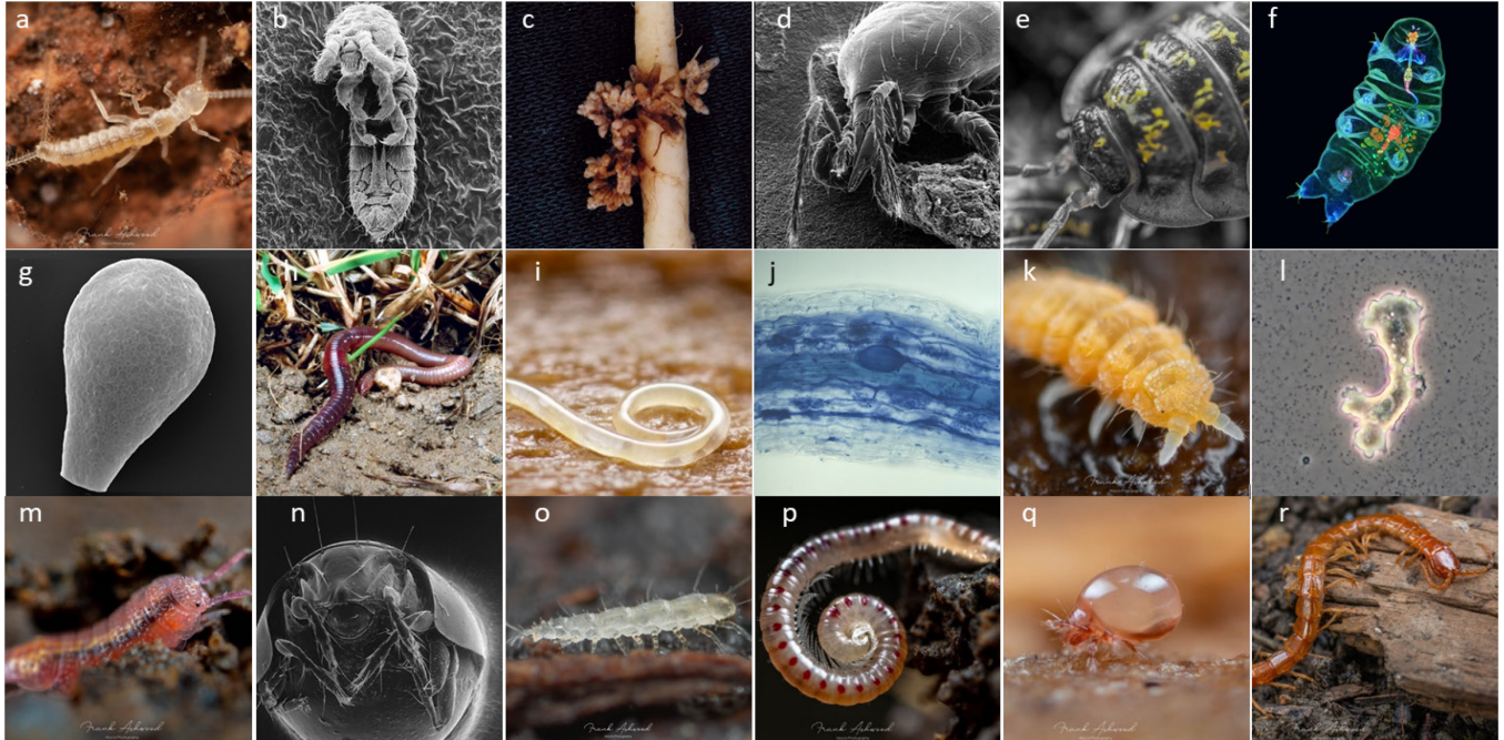
Figure 1: Les sols abritent un quart de la biodiversité mondiale. Si on la favorise correctement, les activités des organismes vivant dans le sol contribuent dans une grande mesure à la qualité du sol et peuvent soutenir la production végétale de manière naturelle. 1

Nous présentons ici l'importance de la santé des sols pour les surfaces agricoles ou horticoles et montrons les possibilités de protéger les sols et même de rendre les processus naturels utilisables pour la production végétale. La protection des sols ne doit pas être considérée comme une charge et un surcoût supplémentaires, mais comme un investissement nécessaire pour l'avenir. Seuls des sols sains peuvent fournir des rendements de qualité à long terme et sont résistants aux maladies et aux conditions météorologiques extrêmes.