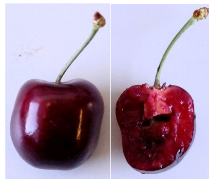
Poisdel: fruit étiré en longueur en raison de la brisure du noyau (2020).