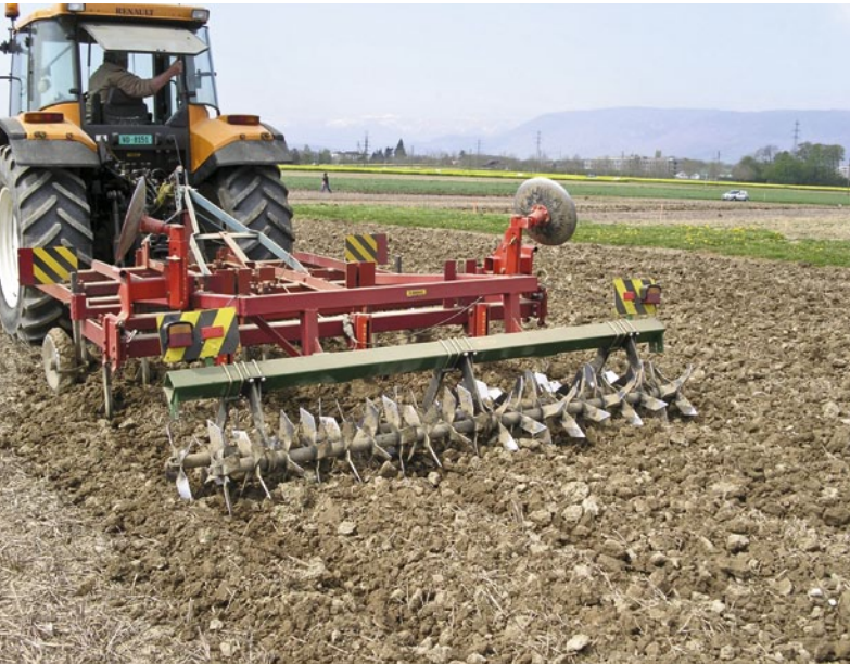
Oberflächliche Bodenbearbeitung mit dem Schälgrubber.