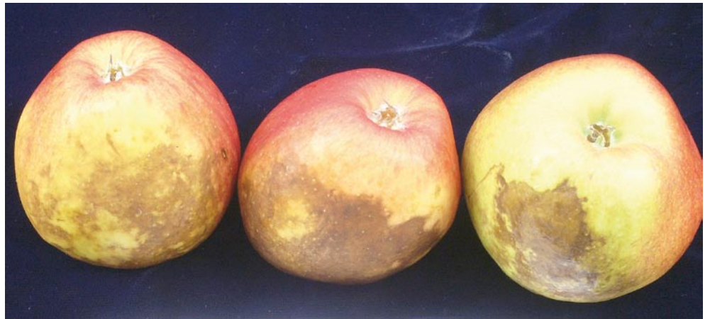
Abb. 3. Hautbräune, eine physiologische Lagerkrankheit.

Eine Reihe von Faktoren beeinflussen das Risiko für Hautbräunebefall, unter anderem die Witterung (Jahreseffekt), der Reifegrad bei der Ernte, die Lagerbedingungen sowie die Lagerdauer. In unseren mehrjährigen Untersuchungen wurden deshalb Äpfel der Sorte Maigold in jeweils wöchentlichen Abständen, also in vier verschiedenen Reifestadien, geerntet und bei unterschiedlichen Bedingungen gelagert. Auslagerungen wurden nach drei, fünf und acht Monaten vorgenommen und der Hautbräunebefall bestimmt. Am Beispiel der Versuchsergebnisse des Erntejahres 2004 wird der Einfluss verschiedener Faktoren und die Wirkung von MCP auf die Hautbräune dargestellt (Tab. 3). Bei den Proben aus dem Kühllager wurde Hautbräunebefall erstmals bei der Auslagerung im März beobachtet. Bei allen Pflückzeitpunkten waren befallene Früchte zu verzeichnen, am wenigsten bei Pflückzeitpunkt 2. Im CA-Lager war am Posten PZP1 ein erster geringer Befall im März zu verzeichnen. Bei der Auslagerung im Mai war dann bei einem grösseren Anteil der Früchte der Pflückzeitpunkte 1, 3 und 4 Hautbräunebefall zu verzeichnen. Durch die MCP-Behandlung konnte der Hautbräunebefall im Kühllager stark verzögert und im CA-Lager bisher – auch bei längerer Lagerung bis anfangs Juni – vollständig