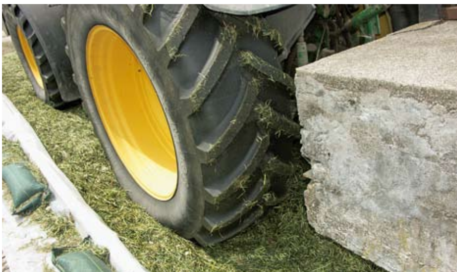
... doch muss dazu die einwandfreie Pressung im Fahrsilo stimmen.

Lohnunternehmen sind in der Schweizer Landwirtschaft als Dienstleistungsbetriebe bei Feld- und Erntearbeiten nicht mehr wegzudenken. Dabei stellen die Auftraggeber hohe Anforderungen an die Arbeiterleistung generell und speziell, was die Raufutterkonservierung betrifft. Was ist diesbezüglich speziell zu beachten und was muss der Lohnunternehmer über Siliermittel wissen?