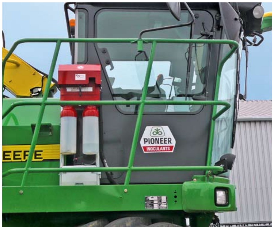
Siliermittelapplikation: Die Technik mit Ultra-Low Volume-Dosierung kann nur beim Häcksler eingesetzt werden.