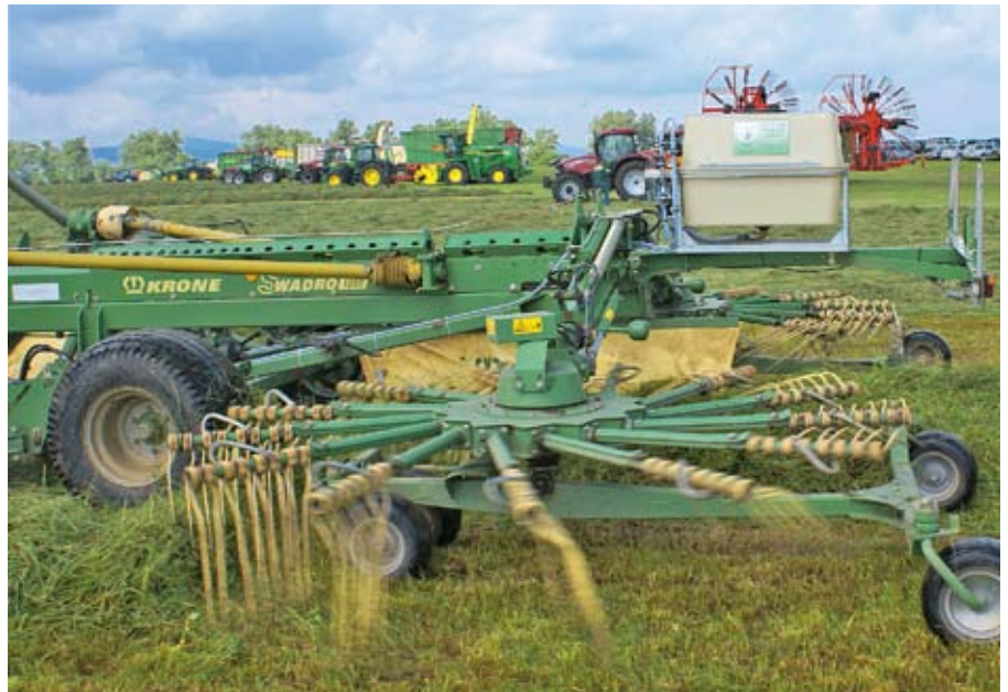
Wenn Siliermittel eingesetzt werden, dann müssen die Siliermittelwahl, die Einsatzmenge und die Verteilung stimmen.

Beherrschung der guten fachlichen Praxis der Silobefüllung, Verdichtung und Abdeckung. Zudem werden fertige Silagen und befüllte Silos im Sinne des Qualitäts-Controllings beurteilt. Bei einer entsprechenden Nachfrage, müsste der Verband der Lohnunternehmer sich überlegen, einen solchen Kurs auch einmal in der Schweiz anzubieten. ■