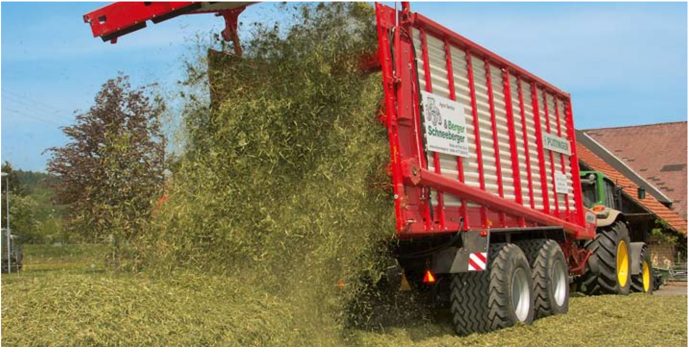
Hohe Schlagkraft sichert beste Qualität...