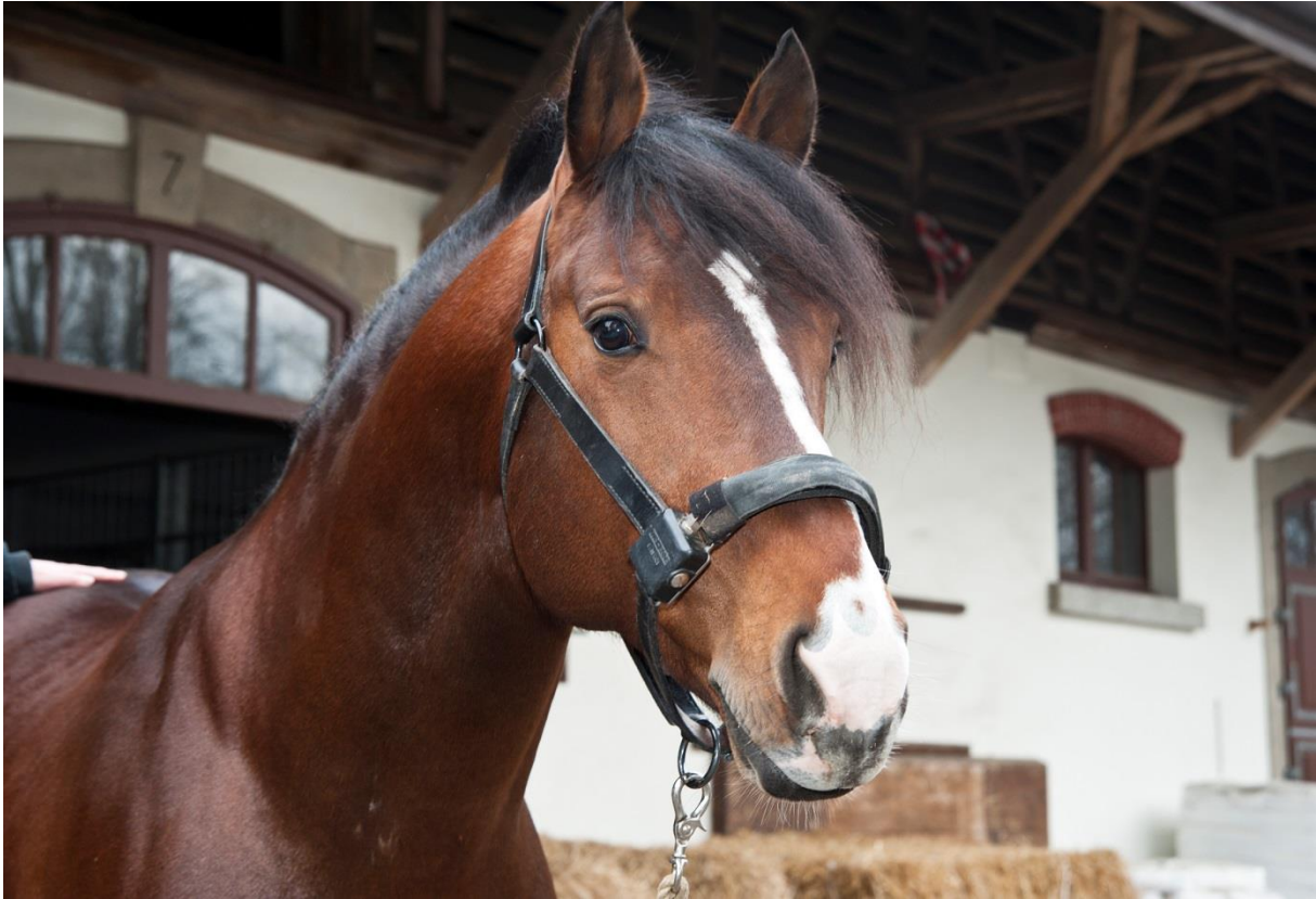
Abb.1: Anwendungsbeispiel des automatischen Messsystems.