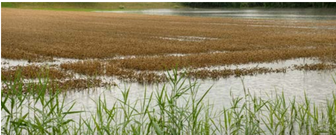
Le piogge copiose e altri eventi meteorologici estremi hanno portato a perdite del raccolto talvolta considerevoli nel 2021.

2,1 per cento del consumo pro capite, a fronte di un'offerta sempre scarsa (Proviande, 2022; Agristat, 2022). Anche la detenzione di pollame ha contribuito alla crescita dei ricavi dalla detenzione di animali grazie alla domanda interna in costante ascesa di uova e carne di pollame di origine svizzera (UFAG, 2022c; Proviande, 2022). Mentre i prezzi alla produzione delle uova sono rimasti stabili, quelli della carne di pollame sono aumentati leggermente (Agristat, 2022). Contrariamente alla detenzione di bovini, bestiame da latte e pollame, quella di suini ha registrato ricavi inferiori, uno sviluppo attribuibile al calo dei prezzi dei suini (-12,9%; Agristat, 2022), innescato dall'espansione della produzione legata al ciclo suinicolo (+2,5%; Proviande, 2022). Dopo un calo della domanda protrattosi per molti anni, il consumo pro capite di carne suina è leggermente aumentato nel 2021 (+1,0%; Proviande, 2022). Questa progressione non è bastata tuttavia a smerciare tutta la quantità aggiuntiva prodotta rispetto all'anno precedente.