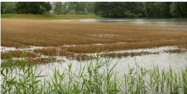
Les pluies excessives et autres conditions météorologiques extrêmes ont entraîné des pertes de récolte parfois considérables en 2021.

Les produits des immeubles de l'exploitation ont également eu un impact positif en 2021, puisqu'ils ont augmenté de 4,8 %. Cette évolution s'explique par l'augmentation des recettes locatives effectives et des loyers propres fictifs internes à l'exploitation. Pour ces derniers, il s'agit d'un effet comptable, étant donné que davantage de loyers fictifs internes à l'exploitation (loyers propres) pour des locaux commerciaux ont été comptabilisés. Mais ceux-ci sont également comptabilisés comme charges (locations et charges de fermage) et n'ont donc pas d'incidence sur le résultat, c'est-à-dire qu'ils n'ont pas d'effet sur le revenu agricole. Les paiements directs (contributions cantonales comprises) par exploitation ont augmenté en moyenne de 1,2 % alors que le montant total des paiements directs versés par la Confédération au secteur agricole est resté pratiquement inchangé. Cette augmentation est due à la poursuite de la restructuration et à l'augmentation de la surface des exploitations agricoles (+1,3 % en 2021) qui en découle.