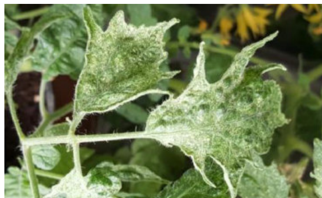
Abb. 2 | Verschmälerte Tomatenblätter.