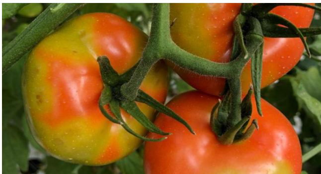
Abb. 3 | Tomaten reifen unregelmässig.

Da das Virus erst vor kurzem entdeckt wurde, gibt es noch keine schnelle und zuverlässige Detektionsmethode dafür. Empfohlen wird die Kombination von zwei molekularbiologischen Methoden (RT-PCR, um allgemein Tobamoviren zu detektieren, und anschliessende Sequenzierung), was die Diagnostik aufwändiger und zeitintensiver macht.