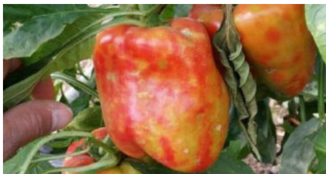
Abb. 5 | Symptome auf Paprikafrüchten.

Das Virus dringt durch kleinste Wunden in die Pflanze ein und wird von der Wirtspflanze in sehr grossen Mengen reproduziert. Deshalb werden die Viren sehr leicht mechanisch über Berührung (z. B. Hände, Kleider und Werkzeuge), Kontakt von Pflanze zu Pflanze, über Bewässerungssysteme, kontaminiertes Saatgut oder durch die vegetative Vermehrung von Pflanzen übertragen. Hummeln können das Virus zudem bei der Bestäubung verbreiten, sowohl innerhalb als auch zwischen Gewächshäusern (Transport von Hummelvölkern). Über weite Strecken wird das Virus über infizierte Jungpflanzen und Samen verbreitet. Tobamoviren sind zudem sehr stabil und können über Monate ohne Wirtspflanzen auf verschiedensten Oberflächen, im Boden und auf Pflanzenrückständen überdauern.