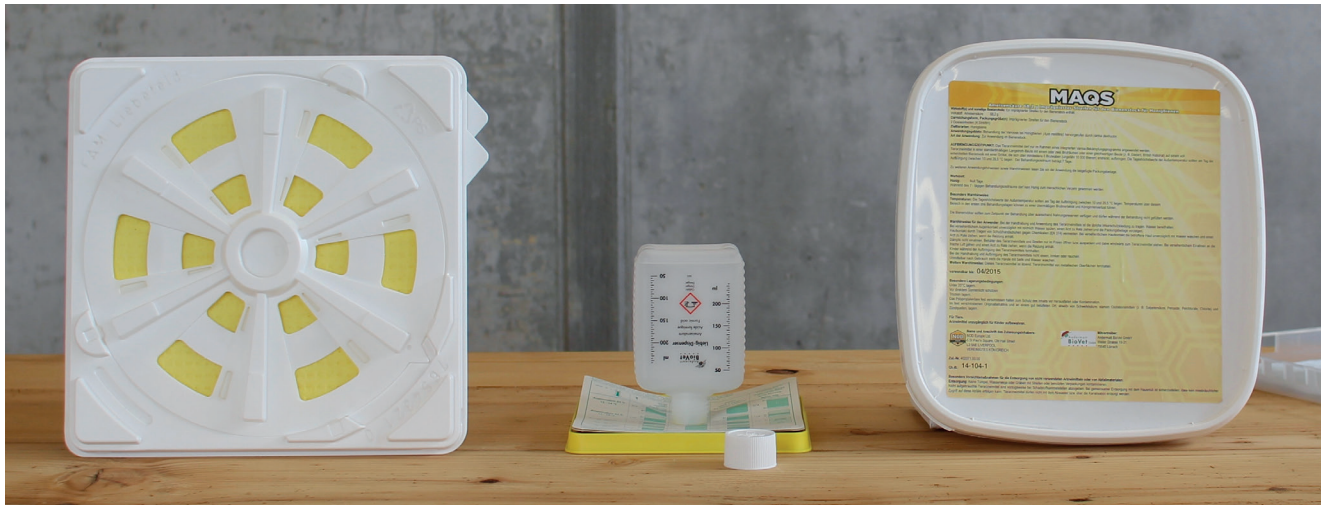
FAM-, Liebig, MAQS- und Nassenheider Pro-Dispenser (von links nach rechts).

Jedes Jahr müssen Imker die Varroa unter Kontrolle bringen. Das Varroabekämpfungskonzept sieht zwei Sommerbehandlungen mit Ameisensäure vor. Aber welcher Dispenser soll verwendet werden?