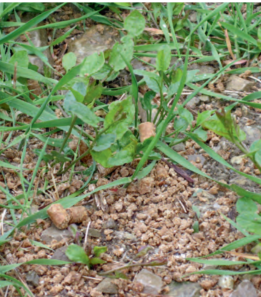
Abb. 2: Ausgebrachter Organischer Handelsdünger (1.5 t/ha) vor der Einarbeitung.