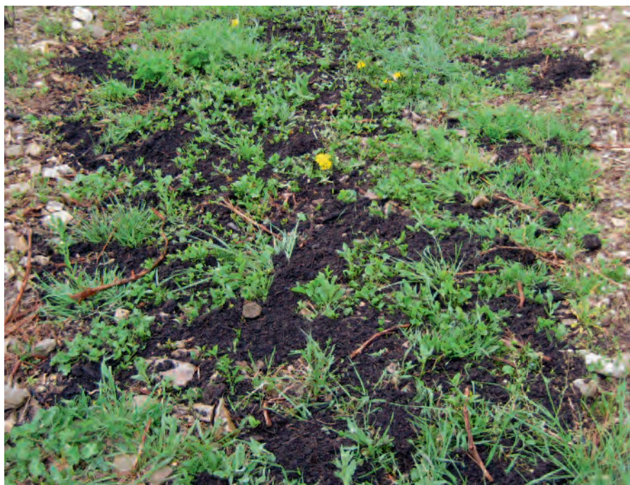
Abb. 1: Ausgebrachter Qualitätskompost A + (15 t/ha) vor der Einarbeitung.

Nach der Düngung erfolgten jeweils ein Umbruch und eine oberflächliche Einarbeitung mit dem Grubber