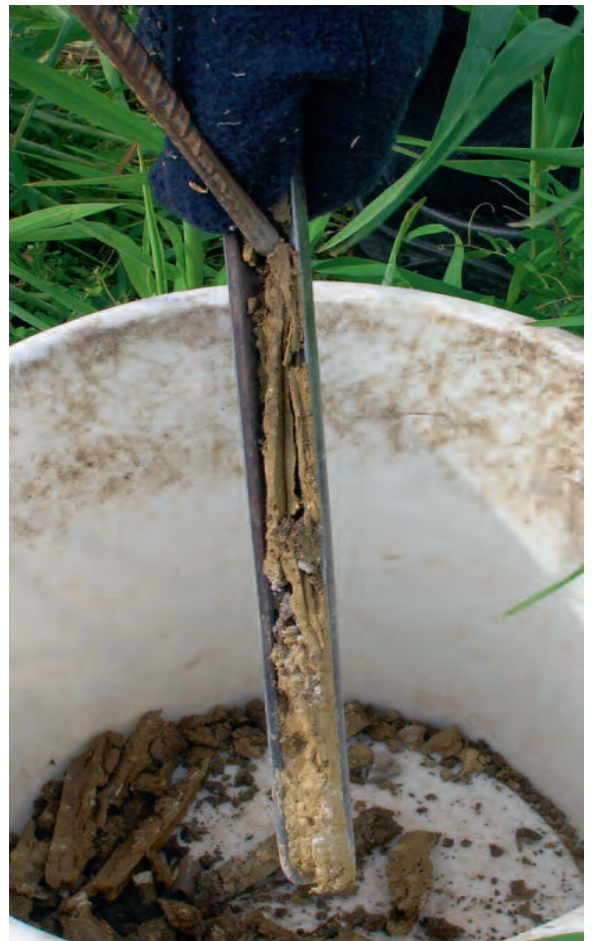
Abb. 4: Bodenprobenentnahme zur Analyse des mineralischen Stickstoffs.