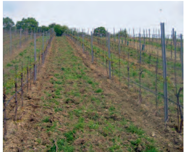
Abb. 3: Fläche nach der seichten Einarbeitung der organischen Dünger mit dem Grubber.