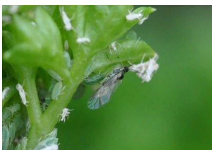
Photo 12: Adulte ailé du puceron du saule ( Cavariella aegopodii ) sur persil, ici au centre de l'image.

Pour lutter contre les pucerons sur les salades pommées cultivées sous abris, on obtient la meilleure protection de la jeune masse foliaire avec des substances actives systémiques tel spirotétramate (Movento SC; délai d'attente 2 semaines) ou acétamipride (divers produits; délai d'attente 2 semaines). Bio : l'azadirachtine A (BIOHOP DelNEEM, Neem MAAG, NeemAzal-T/S), partiellement systémique, peut être utilisée contre les pucerons sur salades pommées, avec un délai d'attente d'une semaine.