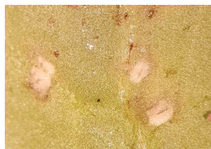
Photo 10: Ces pustules blanches à la face inférieure d'une feuille de radis permettent d'identifier une attaque de rouille blanche.