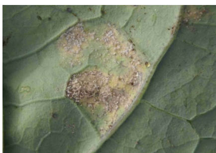
Photo 8: Duvet grisâtre de sporanges de mildiou des brassicacées, ici à la face inférieure d'une feuille de brocoli.

Sont autorisés pour lutter contre la rouille blanche sur les radis : l'azoxystrobine (divers produits) avec un délai d'attente de 2 semaines. Veillez à respecter les consignes d'utilisation. D'autre part, on peut utiliser sur radis l'acibenzolar-S-méthyle (Bion) avec un délai d'attente d'une semaine.