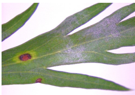
Photo 4: L'oïdium et les maladies à taches foliaires ( Alternaria d. / Cercospora c. ) se manifestent ensemble sur les carottes.