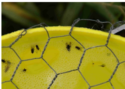
Photo 2: Sur le Plateau, le vol de la mouche du chou est encore en cours dans plusieurs des sites surveillés. Il faut s'attendre à de nouvelles pontes dans les régions menacées.