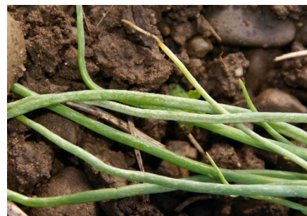
Photo 3: Dans certains sites, on observe en plein champ comme en tunnels la présence d'effectifs assez élevés de thrips ( Thrips tabaci ) dans les jeunes cultures d'oignons, dont le contrôle est recommandé.