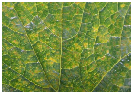
Photo 14: Décolorations réparties en damier à la face supérieure d'une feuille de courgette, causées par le mildiou (photo: Agroscope).