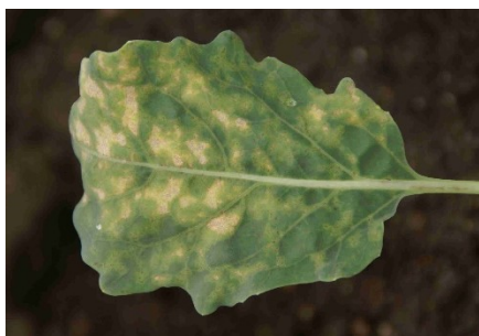
Photo 7: Nombreuses plages décolorées à la face supérieure d'une feuille de colrave, consécutives à une attaque de mildiou.