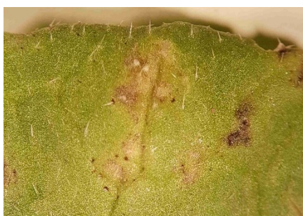
Photo 9: Le jaunissement et le brunissement d'une zone tissulaire à la face supérieure d'une feuille de radis indiquent que l'on est en présence d'une maladie.