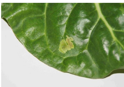
Photo 13: Galerie sous-laminaire de la mouche de la betterave dans une feuille de bette à côtes.

En culture bio , on peut utiliser, avec un délai d'attente de 3 jours : pyréthrine (BIOHOP DelTRIN), pyréthrine + huile de sésame raffinée (divers produits) ou l'extrait de Quassia (Quassan). Le délai d'attente est d'une semaine pour les acides gras (Oleate 20, Siva 50, Vesol Pro, Vista) ; sont également autorisés les acides gras BIOHOP DelMON, Lotiq, Natural et Neudosan Neu.