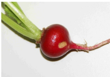
Photo 1: Les jeunes limaces grises ( Deroceras sp.) sont fréquemment responsables de dégâts de nutrition sur les pseudobulbes de radis et de chou-raves.