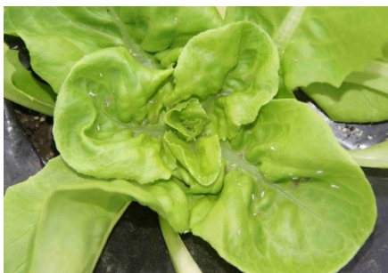
Photo 11: Pucerons pâles de l'espèce Acyrthosiphon lactucae et leurs exuvies sur une salade pommée en tunnel.