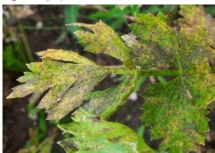
Photo 5: Les taches foliaires de Septoria apiicola se répandent massivement dans les cultures de céleri proches de la récolte (photo: Daniel Bachmann, Strickhof, Winterthur).