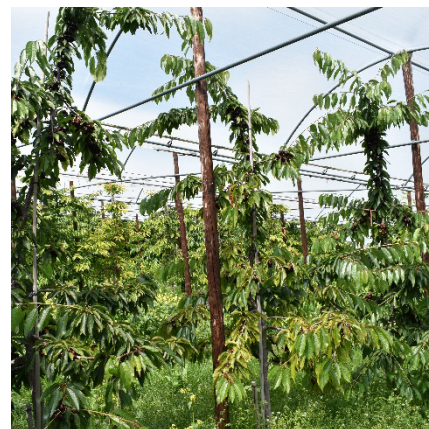
PA3UNIBO mit guter Verzweigung und breitwüchsigen Ästen.

3. bis 4. KW und hat Potenzial für Verbesserungen des Sortiments in der Reifezeit von Vanda, Grace Star und Christiana. Ihre Anfälligkeit gegenüber Pseudomonas und Monilia erfordert eine sorgfältige Berücksichtigung der Standorteignung.