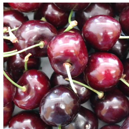
Attraktive Früchte von PA3UNIBO.