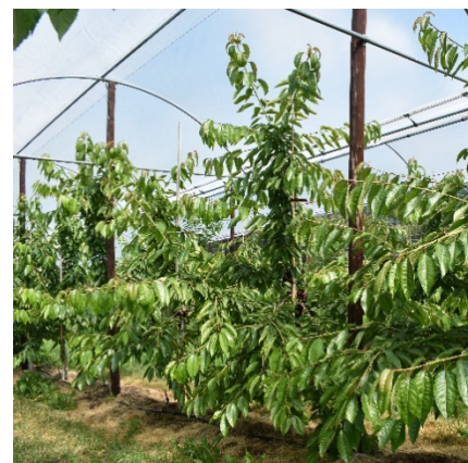
Sehr schöne waagrechte Astabgänge und Verzweigung bei Fertille.

Fertille ist eine ertragreiche Tafelkirsche mit einem sehr hohen Anteil an Klasse Premium. Die Sorte überzeugt bezüglich der Fruchtgrösse, Fruchtfleisfestigkeit, Farbe und Geschmack. Schöne Wuchsform, gut verzweigen- des und vitales Wachstum.