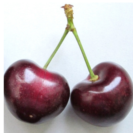
Gute Pflückbarkeit bei Fertille trotz kurzen Stielen.