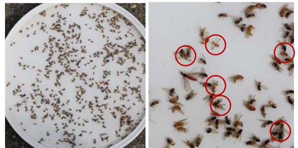
Einfache Bestimmung von Männchen