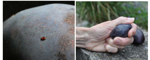
Eiablagen auf Zwetschge und Saftaustritt bei leichtem Druck