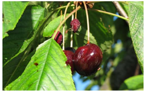
Hängengebliebene Kirschen sind Brutstätten

8. Unternutzen/Mehrfachrückstände: Einige Pflanzenschutzmittel (siehe Allgemeinverfügung und PSMV) haben Auflagen gegenüber von Gewässern, Verfütterung bei Vieh und sind bienengiftig. Die Einhaltung der Auflagen der Mehrfachrückstände kann nicht garantiert werden.