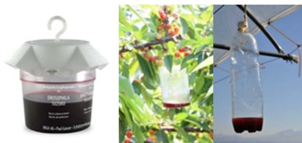
Surveillance: Piège Riga, Piège Agroscope, Piège en PET avec des trous de 3mm