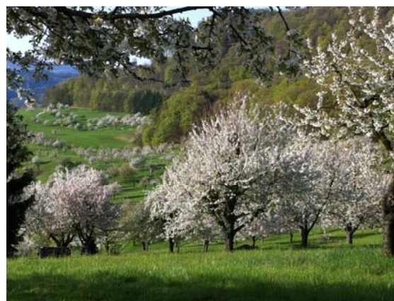
Les vergers haute-tige sont très attractifs pour DC