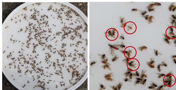
Identification simple des mâles

Les conditions d'utilisation doivent être strictement respectées; elles sont disponibles sous www.blw.admin.ch