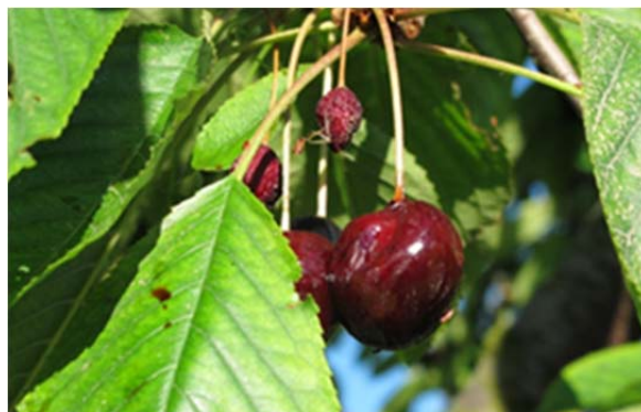
Les cerises non-récoltées sont des foyers de multiplication

8. Utilisation/Résidus multiples: Certains pesticides (voir Décision et Index des produits) ont des charges à l'égard des eaux, de l'alimentation du bétail et sont toxiques pour les abeilles. La conformité avec les exigences des résidus multiples ne peut pas être garantie.