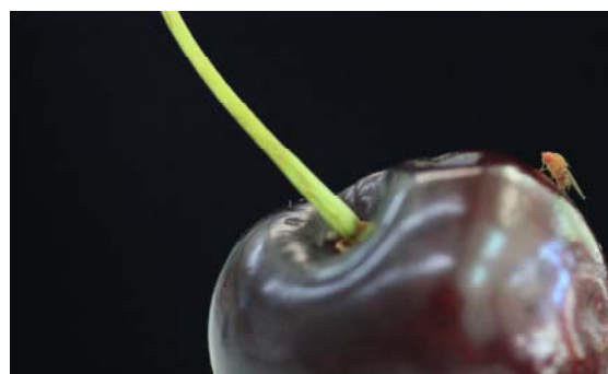
Femelle sur une cerise