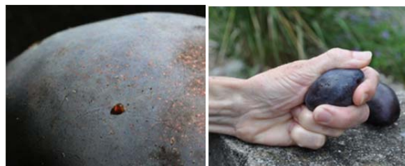
Ponte sur prune et exsudat de jus suite à une légère pression