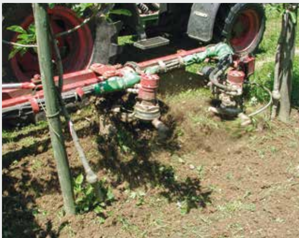
Figure 1 | Utilisation de l'émotteuse.

L'influence des différentes stratégies de lutte sur l'évolution des teneurs en N_{\min} était relativement faible. Les différences en teneurs en N_{\min} observées entre les variantes peuvent pour la plupart s'expliquer indirectement par la régulation de la croissance des mauvaises herbes. Il a été constaté qu'avec les variantes qui présentent un degré élevé de couverture du sol et une repousse rapide des mauvaises herbes (fig. 2), le prélèvement de l'azote était plus important que dans les variantes avec une faible couverture du sol. Ceci a par exemple été observé en 2019 sur le site de Schlachters dans une jeune parcelle de Jonagold, année marquée par de fortes précipitations. La variante «émotteuse au printemps puis éclaircisseuse à fils de nylon rotatifs en été» et celle à base d'acide pélargonique présentaient une forte croissance des mauvaises herbes en été. Dans ces variantes ont été mesurées des teneurs en N_{\min} dans le sol nettement plus faibles que dans les autres stratégies: «émotteuse toute l'année», «herbicide avec glyphosate» et variantes combinées (chimique + mécanique).