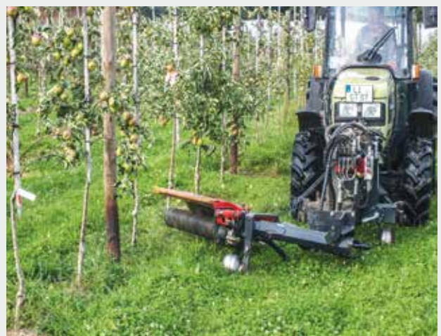
Figure 2 | Après l'utilisation de l'éclaircisseuse à fils de nylon rotatifs ou après application d'acide pélargonique, les mauvaises herbes repoussent rapidement. Cela entraîne une concurrence pour l'azote plus élevée que dans les variantes où la couverture du sol est plus faible.