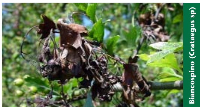
Biancospino (Crataegus sp)