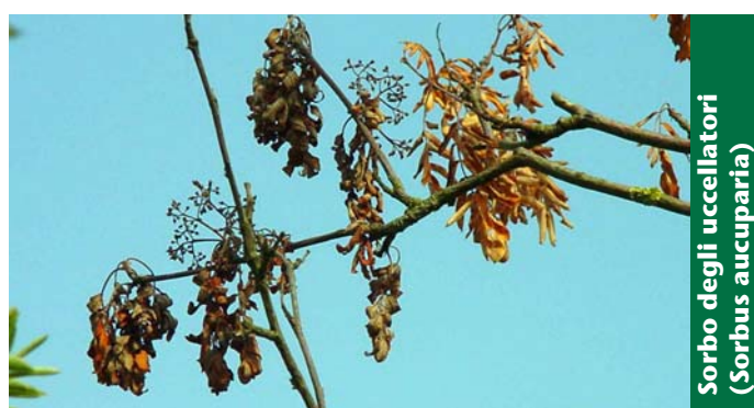
Sorbo degli uccellatori ( Sorbus aucuparia )