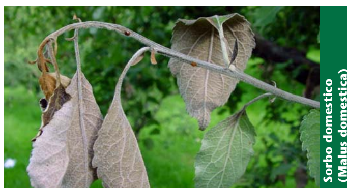
Sorbo domestico ( Malus domestica )