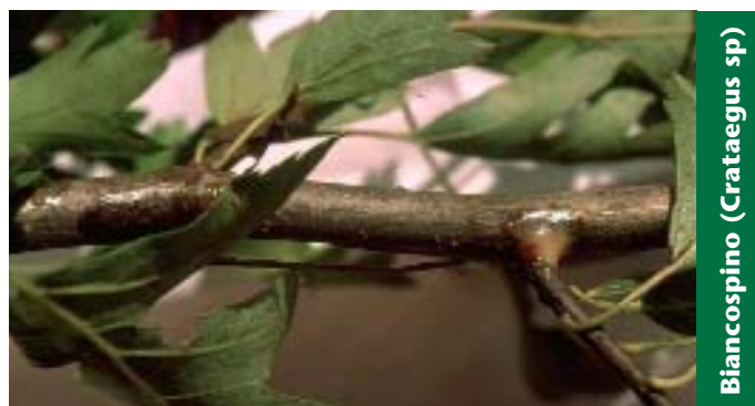
Biancospino (Crataegus sp)