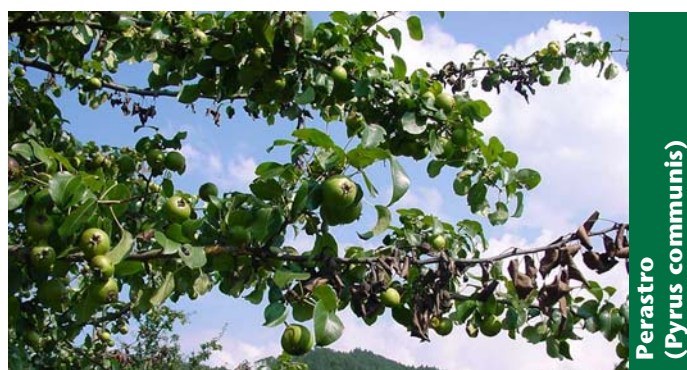
Perastro ( Pyrus communis )