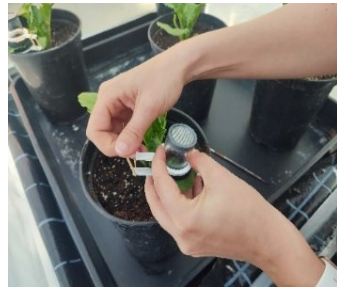
Transmission du virus aux betteraves en serre à Agroscope Changins