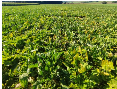
Une variété tolérante (note de 2) est comparée à une variété sensible (note de 6) dans l'essai d'Engolon au Val de Ruz en 2023