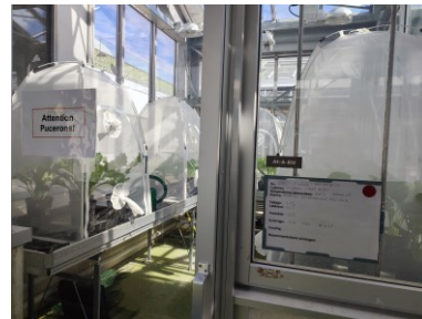
Betteraves virosées sur lesquelles se multiplient les pucerons à inoculer au champ