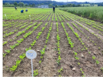
Parcelle inoculée avec le virus BYV