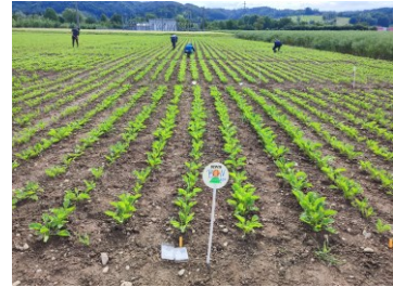
Parcelle inoculée avec le virus BChV