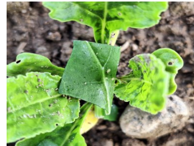
Un morceau de feuille, avec un minimum de 5 aptères virosés, est mis au cœur des betteraves au stade 4-6 feuilles