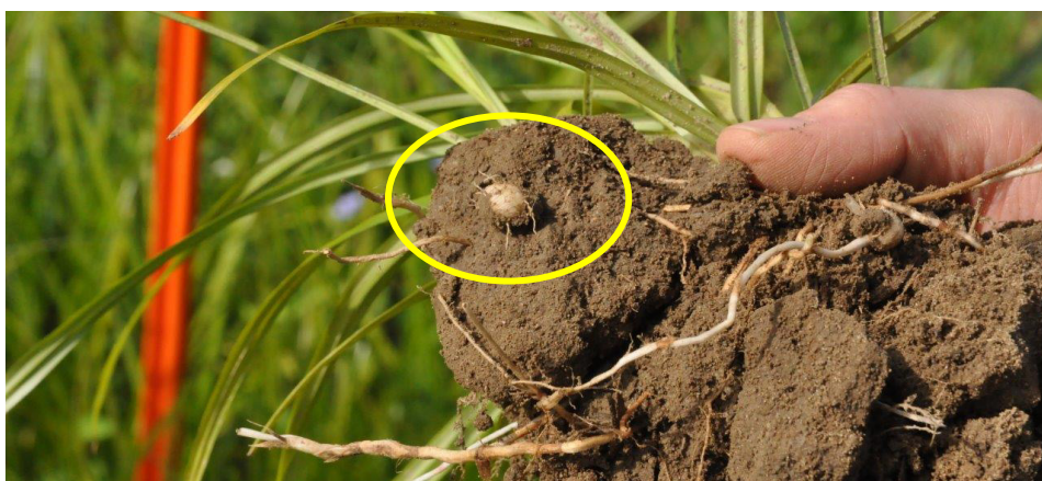
Fig. 1: Le souchet comestible a déjà formé de nouvelles bulbilles, que l'on reconnaît à leur teinte claire.

Le souchet comestible ( Cyperus esculentus ) a déjà formé de nouvelles bulbilles (fig. 1). On peut aussi observer des inflorescences, notamment en bordures des champs. Il s'agit parfois de plantes isolées (fig. 2), mais on trouve aussi des foyers denses de souchets garnis d'innombrables inflorescences (fig. 3).