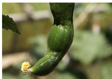
Photo 9: Dans de nombreuses cultures de plein champ et de serre, on observe une présence massive de punaises ( Lygus sp.). Leurs piqûres de succion laissent de nombreuses marques infundibuliformes et des déformations sur les salades, les bettes à côtes, les légumes fruits et autres, comme ici sur un concombre de serre.