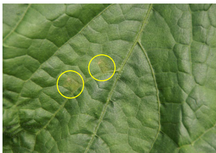
Photo 14: Malgré la période de beau temps, on a découvert les premières taches de mildiou (cercles jaunes) dans une jeune culture de concombres de serre, peu avant la première récolte (photo du 11 juillet 2022 par Agroscope).

Si, malgré l'introduction de parasitoïdes, il s'avère nécessaire d'intervenir avec traitement correctif, il convient d'utiliser en premier lieu la substance active azadirachtine A (BIOHOP DeINEEM, Neem MAAG, NeemAzal-T/S; délai d'attente 3 jours), qui ménage les auxiliaires. Contre les mouches mineuses en cultures de tomates sous abris, on peut aussi utiliser -avec un même délai d'attente de 3 jours- abamectine (Vertimec Gold), lambda-cyhalothrine (divers produits) ou spinosad (divers produits). Ces trois substances auront par contre un effet délétère, voire fatal, sur les auxiliaires.