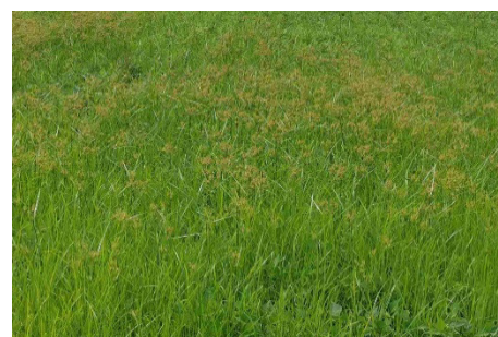
Fig. 3: Infestation dense de souchet comestible garni d'innombrables inflorescences.

Martina Keller und René Total (Agroscope) martina.keller@agroscope.admin.ch