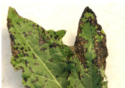
Photo 4: Sur les feuilles proches du sol des dents-de-lion cultivées, on peut observer des attaques bactériennes. Des taches foliaires brun foncé se forment et fusionnent souvent en plages nécrotiques.