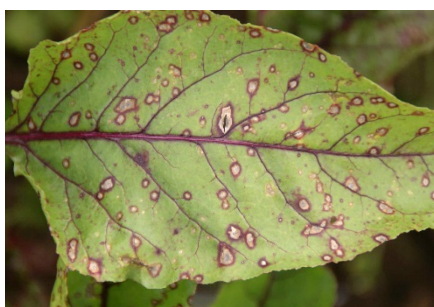
Photo 7: En Suisse orientale, on signale sur les betteraves à salade et les bettes à côtes une augmentation des maladies à taches foliaires causées par exemple par Cercospora beticola et Ramularia beticola.