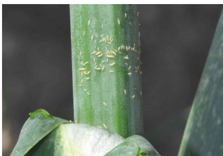
Photo 12: Pullulation de larves de thrips ( Thrips tabaci ) sur un fût de poireau.