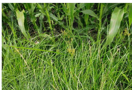
Fig. 2: Le souchet comestible occupe et met à profit la «niche» des bordures des champs.

Pour réduire durablement l'infestation de souchet comestible, il faut à tout prix empêcher la formation de bulbilles et de graines. Si l'on voit des plantes en fleurs, il faut si possible en faucher les inflorescences et les éliminer avec les déchets à incinérer. En bordure de champ, il convient au moins de gyrobroyer le souchet pour empêcher la formation de graines et freiner l'émission souterraine de bulbilles.