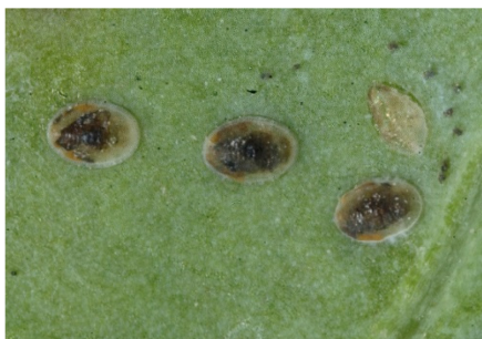
Photo 11: Trois pupes de mouches blanches du chou brunâtres après avoir été parasitées par l'hyménoptère Encarsia tricolor . La pupe visible en haut à droite est déjà vide.