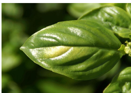
Photo 8: Il faut s'attendre dès maintenant à l'apparition du mildiou ( Peronospora belbahrii ) sur le basilic. Une première attaque a été observée lundi dans une culture de plein champ du canton de Zürich.