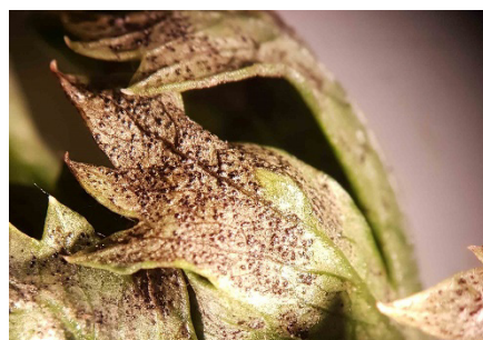
Photo 6: Lors des contrôles des champs de ce lundi, on a découvert dans une culture de céleris couvrant presque les rangs, la présence d'une forte densité de fructifications de Septoria apiicola sur une seule plante. La surveillance des cultures est importante en ce moment!