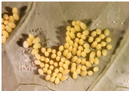
Photo 2: La ponte des piérides bat son plein actuellement. Elle est illustrée ici par un dépôt d'œufs de la piéride du chou ( Pieris brassicae ). Il est recommandé de contrôler les cultures.