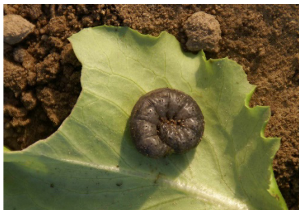
Photo 1: Le vol de la noctuelle des moissons ( Agrotis segetum ) augmente à nouveau sur le Plateau. Dans un cas, on signale déjà une plus forte infestation de vers gris.