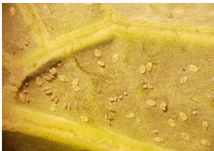
Photo 10: Semblables à des cochenilles, les larves de mouches blanches du chou éclosent de leurs œufs lancéolés sur une feuille de chou.