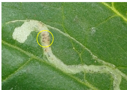
Photo 13: Visualisation du parasitage réussi d'une larve de mouche mineuse Liriomyza sur tomates: le dernier stade larvaire de l'hyménoptère parasitoïde Diglyphus isaea accomplit sa pupaison à quelque distance de la fin de la galerie; il est alors entouré de crottes (points sombres dans le cercle) (photo: Christof Gubler, Strickhof, Winterthur).