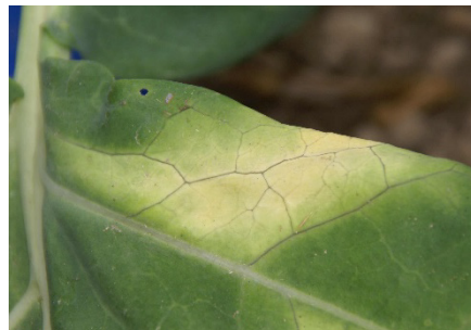
Photo 3: Chez les choux, les plages jaunissantes progressant depuis les bords du limbe sont typiques de la maladie des nervures noires causée par Xanthomonas campestris . Dans la zone atteinte, les nervures gardent une teinte foncée.