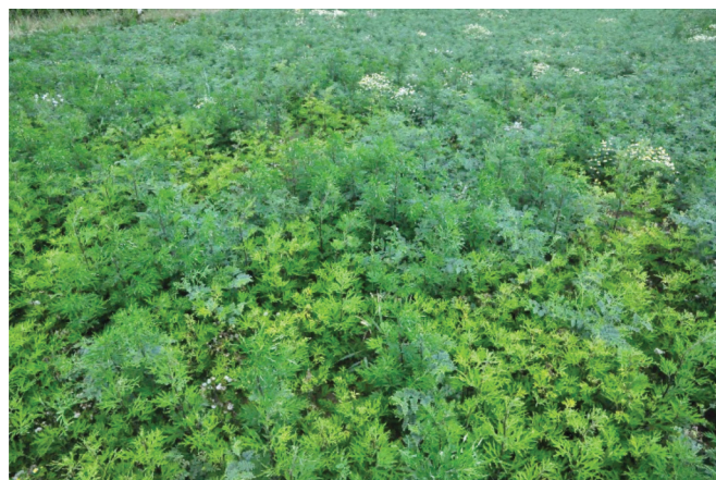
Fig. 3: Parcelle entièrement envahie d'armoise vulgaire ( Artemisia vulgaris ): c'est le tout dernier moment pour engager la lutte!.