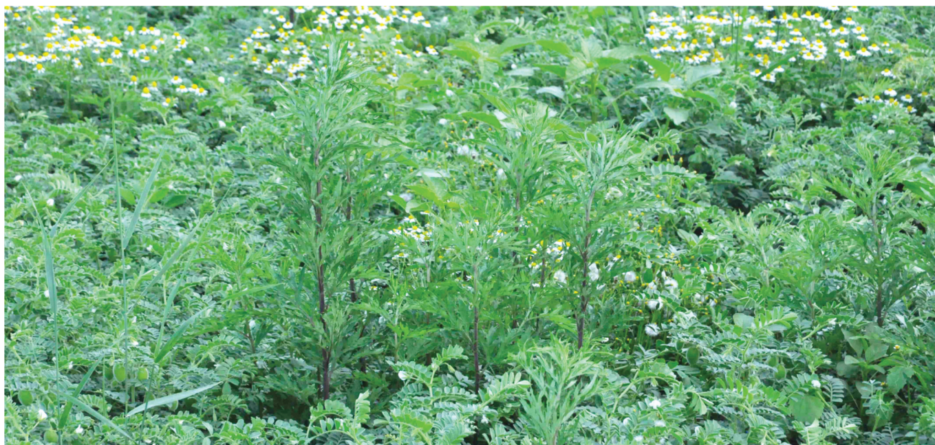
Fig. 1: Envahissement d'une culture par l'armoise commune. Il en résulte une diminution, voire une absence de rendement. En outre, la récolte de certaines cultures peut s'avérer beaucoup plus difficile (photo: Agroscope).

L' armoise commune ( Artemisia vulgaris ) est une espèce vivace et fortement concurrentielle. Elle constitue parfois des foyers d'occupation denses, excluant d'autres espèces, et peut aussi se propager par ses graines. Il s'agit d'une plante à fort enracinement, difficile à combattre. Les machines de travail du sol ou de récolte peuvent diviser ses souches et en disperser les fragments dans la parcelle, ou vers d'autres champs.