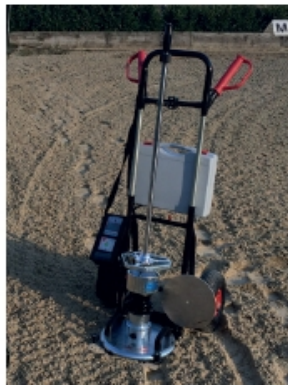
Abbildung 1 Leichtiges Fallgewicht (10 kg) der Firma Zorn.

Für die Erhebung der Daten wurden fünf Reithallen und sechs Aussenreitplätze untersucht, welche ähnliche Bewässerungssysteme und einen vergleichbaren Aufbau aufwiesen. Für die allgemeinen Informationen wurde ein Fragebogen an die Besitzer abgegeben und eine optische Beurteilung des Bodens durchgeführt. Die Art der Nutzung und ob es sich um einen Turnier- oder Trainingsboden handelt wurde ebenfalls erfasst. Die Messparameter wurden anhand der sechs Kriterien für einen Reitboden definiert. Anschliessend wurde der Platz in vier Wiederholungen mit je drei Belastungsstufen (Hufschlag, Ecke, Diagonale) eingeteilt. Die Festigkeit, Dämpfung und Elastizität des Bodens wurde mit dem Leichten Fallgewicht (10 kg) gemessen (Abbildung 1).