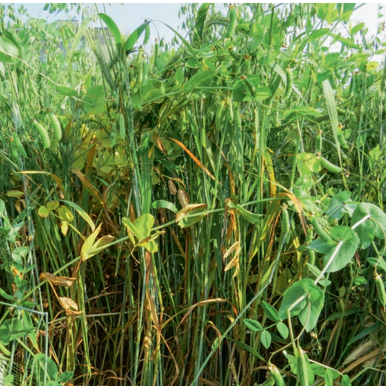
Triticale-Hafer-Erbsen-Mischung zum Zeitpunkt der Ernte.

Auskünfte: Yves Arrigo, E-Mail: yves.arrigo@agroscope.admin.ch