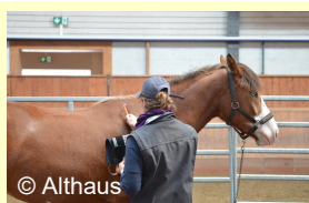
test de sensibilité tactile