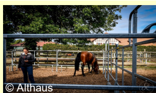
test de présence passive