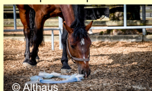
test de l'objet inconnu