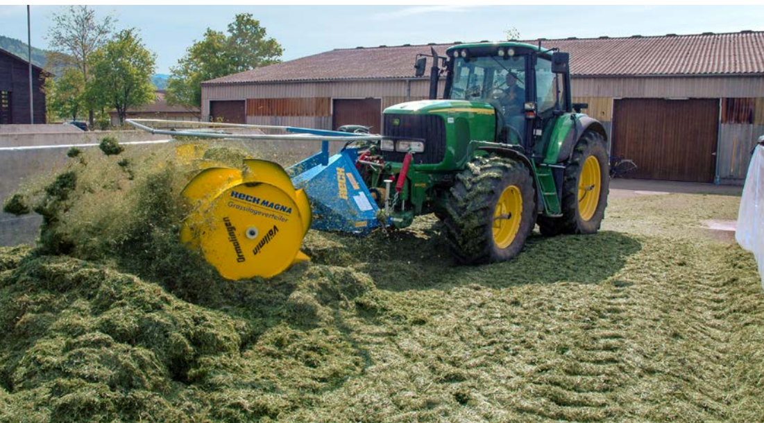
Walztraktor mit Grassilageverteiler auf dem Fahrsilo.

Rohproteingehalt, was der Milchsäurebildung entgegenwirkt. Zu spät geschnittenes Gras ist meist energieärmer und rohfaserreicher und deshalb schlechter verdichtbar, was vermehrt zu Nachgärungen und Schimmelpilzbefall führt.