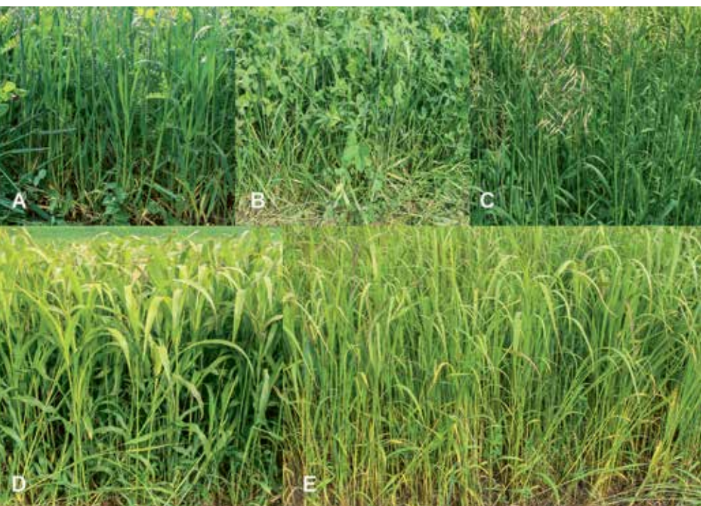
Les deux mélanges standard 101 (A) et 106 (B) de même que de divers mélanges contenant de l'avoine rude (C), du sorgho (D) ou du moha (E) ont été étudiés.

Renseignements: Ueli Wyss, e-mail: ueli.wyss@agroscope.admin.ch