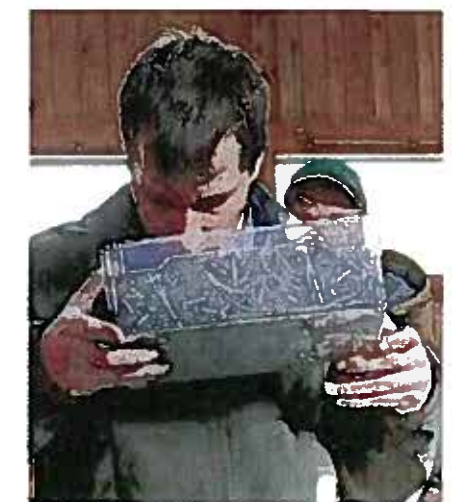
Riecht die Silage nun gut oder schlecht?

dung beim Lohnunternehmer, allenfalls können dann auch bereits Alternativen besprochen werden für den Fall, dass das Wetter nicht mitspielt. Wichtig ist auch eine über alle Arbeitsgänge gut aufeinander abgestimmte Schlagkraft. • Oft wollen die Landwirte noch einzelne Arbeitsschritte wie Mähen, Schwaden oder Walzen selber übernehmen. Doch wenn die Arbeitsgeräte nicht zu jenen des Lohnunternehmens passen, sind Probleme vorprogrammiert. Aus der Sicht der Lohnunternehmer ist die Übernahme der ganzen Erntekette vom Mähen bis zum Einführen beziehungsweise Walzen deutlich besser planbar.