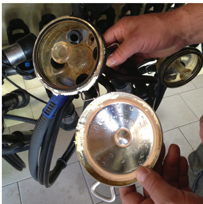
Fig. 3: Collecteur de la griffe d'un agrégat de traite avec des résidus de lait coagulés