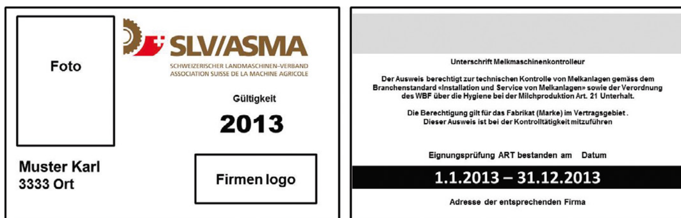
Fig. 4: Les producteurs de lait doivent contrôler la validité du certificat d'aptitude (exemples ASMA).

Tout professionnel qui installe des installations de traite ou effectue des services doit être en possession d'un certificat de capacité de l'Association suisse des fabricants et commerçants de machines agricoles (ASMA) (fig. 4). Le certificat de capacité conforme au standard de la branche est délivré au candidat si celui-ci a réussi l'épreuve d'aptitude et dispose d'un jeu complet d'appareils de mesure étalonnés. Pour se présenter à l'épreuve d'aptitude, il est obligatoire pour tous les importateurs suisses de machines à traite d'avoir suivi le cours de base d'Agroscope ou un cours de formation interne à l'entreprise équivalent et reconnu par Agroscope.