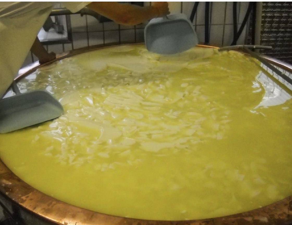
Vacherin mit Molke.