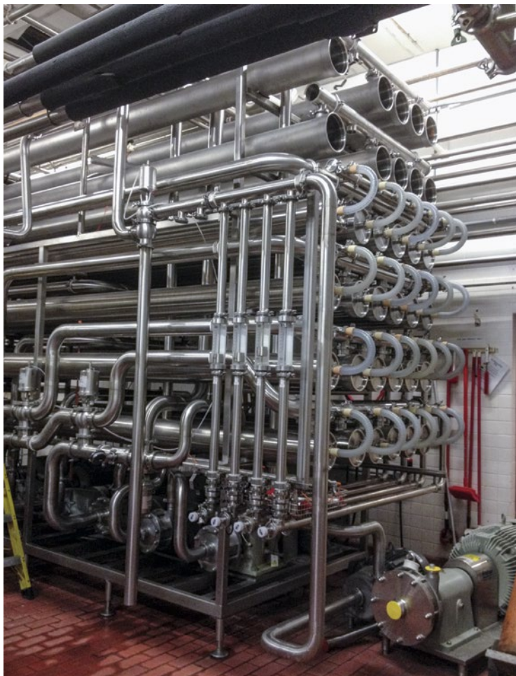
Abb. 2 | Membranfiltrationsanlage.

len Molkenpulver und WPC35 hergestellt, also damit 28100 t Magermilchpulver ersetzt (Annahme: 1 g Molkenpulver/WPC35 können 1 g Magermilchpulver ersetzen), ergibt dieses Szenario eine Einsparung von 312200 t Milch (berechnet nach Pearce 2014). Haupttreiber für die Reduktion der Ökobilanzpunkte ist die durch die Magermilchpulversubstitution eingesparte Menge Rohmilch und damit deren Ressourcenverbrauch (Landnutzung, Klimawandelbeitrag, Wasserschadstoffe, Energie, etc.). Zusatzaufwendungen für das Ersatzfutter Gerste in der Schweinemast, weitergehende Verarbeitung der Molke zu Pulver und der Anfall von zusätzlichem, laktosereichem Permeat (geht in der Rechnung ins Abwasser) vermindern den Einspareffekt durch die eingesparte Milch, wobei aber netto eine Reduktion der Umweltbelastung resultiert. Verarbeitet man hingegen diese Molke zu WPC65 (zweites Szenario), so erhöhen sich die Umweltbelastungen rechnerisch insgesamt. Angenommen wurde eine Substitution von 1,8 g Magermilchpulver durch 1 g WPC65. Es können 10600 t Mager-