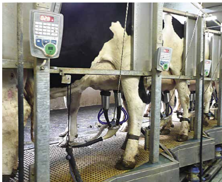
Renate Boss, Agroscope

Les mammites sont la maladie la plus fréquente de la vache laitière et engendrent des pertes annuelles pour l'industrie laitière suisse d'un montant de CHF 130 millions de francs. Parmi les agents pathogènes les plus répandus, on trouve Staphylococcus aureus (abrégé Staph. aureus ). Chez les humains, ce microorganisme peut provoquer des intoxications alimentaires. Agroscope a élaboré une nouvelle méthode de détection issue de la biologie moléculaire et destinée à l'agriculture et à l'industrie laitière.