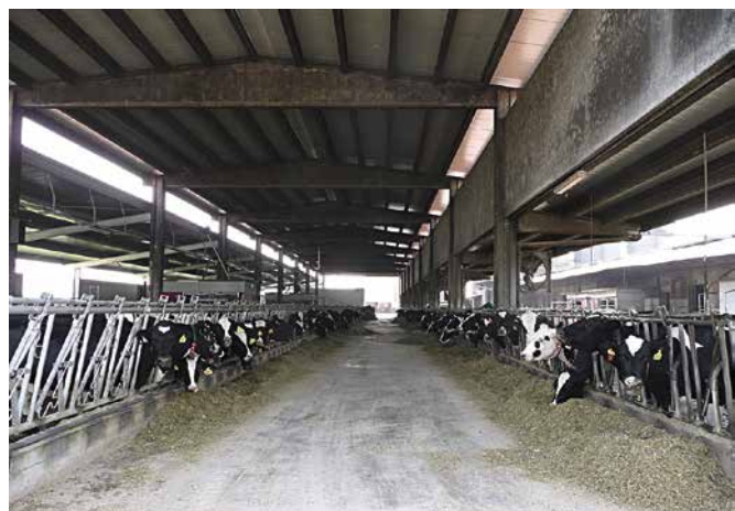
Renate Boss, Agroscope