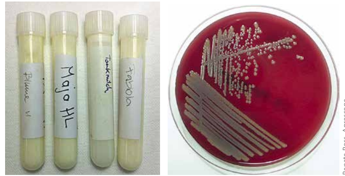
Photo gauche: Echantillons de lait prêts pour analyse Photo droite: Milieux de culture avec des colonies de Staph. aureus

On sait aussi que les quantités de Staph. aureus excrétées par les vaches malades fluctuent fortement (fig. 1/rouge). Or, les nouvelles méthodes de biologie moléculaire (PCR) sont beaucoup plus sensibles et peuvent donc détecter dans le lait des quantités de germes nettement plus faibles (fig. 1/bleu). Ainsi, le prélèvement d'échantillons pour la détection de Staph. aureus est possible à tout moment (on évite les résultats faux négatif).