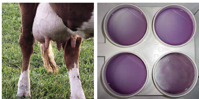
Photo gauche: Mamelle saine à l'examen visuel Photo droite: Test de Schalm positif (en bas, à droite)

D'autres génotypes de Staph. aureus sont aussi à l'origine de mammites, mais n'infectent généralement que quelques animaux dans le troupeau.