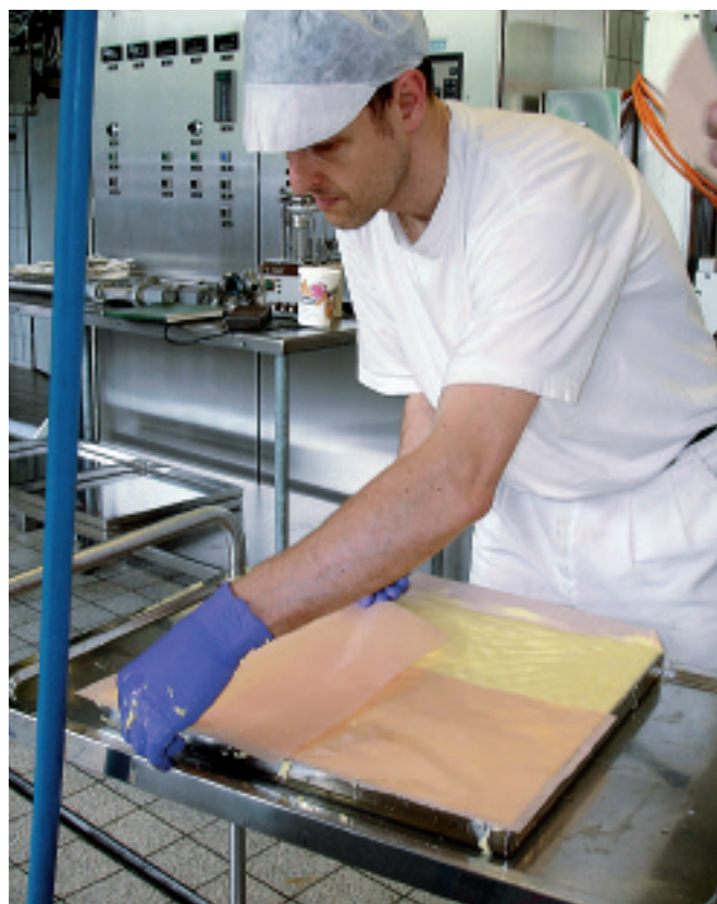
Fig. 1. Fabrication du beurre dans l'installation pilote d'ALP. ▷

Les consommateurs recherchent de plus en plus les denrées alimentaires naturelles possédant une valeur nutritionnelle plus élevée que les produits traditionnels comparables. Dans le cadre d'un projet de l'Union européenne, la Station de recherche Agroscope Liebefeld-Posieux ALP a étudié l'influence de divers processus de transformation sur les composants du lait à valeur nutritionnelle ajoutée, à l'exemple des acides linoléiques conjugués (ALC), qui possèdent de nombreuses propriétés, notamment anticancéreuses. Les processus de transformation influencent-ils la teneur en ALC du produit fini? Les chercheurs d'ALP ont tenté de répondre à cette question en premier lieu par une recherche de littérature et par des analyses effectuées sur des beurres produits de manière biologique et conventionnelle. Par ailleurs, ALP a développé des méthodes pour déterminer la stabilité du beurre vis-à-vis de l'oxydation, qui ont permis d'étudier la stabilité du beurre enrichi en ALC et du beurre conventionnel durant le stockage. Un procédé a en outre été mis au point pour enrichir avec ménagement ( low input ) la graisse de lait en ALC.