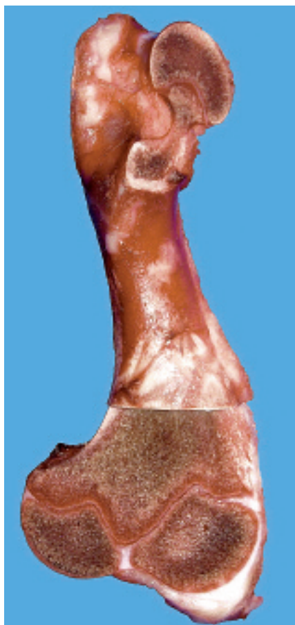
Fig. 2. Os du bras incisé pour l'évaluation du cartilage de l'articulation et de la zone de croissance.

aliment, le rapport Ca:PDP s'élevait à 2,8:1 conformément aux recommandations d'ALP (2004). Aucune phytase n'a été utilisée pour améliorer la digestibilité de Ca et de P.