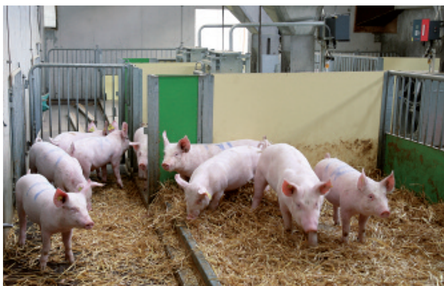
Fig. 1. Les animaux de chaque variante ont été détenus en groupes dans des box munis d'une grande surface de repos avec litière et d'un caillebotis. La consommation d'aliments de chaque animal a été enregistrée par le distributeur automatique.

L'apport en phosphore digestible (PDP) recommandé par ALP a été examiné chez des porcs qui pesaient 15 kg au début de l'essai et qui ont été abattus à 45 kg. Les animaux témoins (P) ont reçu des aliments contenant la teneur recommandée en PDP, alors que les aliments des trois groupes expérimentaux P-, P+ et P++ en contenaient respectivement 20% de moins, 20% et 40% de plus. Dans toutes les rations, le rapport calcium (Ca):PDP était de 2,8:1. Les porcs du groupe P++ ont grandi moins rapidement que ceux des groupes P et P- (620 g contre 665 g et 680 g, P < 0,001 ). L'apport inférieur de 20% en Ca et en PDP dans les rations P- a eu pour conséquence que les os métacarpiens des animaux abattus à 45 kg de PV contenaient moins de Ca ( P < 0,05 ) et se brisaient avec une plus légère sollicitation mécanique ( P < 0,05 ) que ceux des animaux du groupe P+. La teneur des aliments en Ca et en P n'a pas eu d'influence sur l'étendue des lésions au niveau des cartilages des os des pattes. Les résultats montrent que l'apport en Ca et en PDP recommandé par ALP pour les jeunes porcs permet d'assurer une bonne ossification.