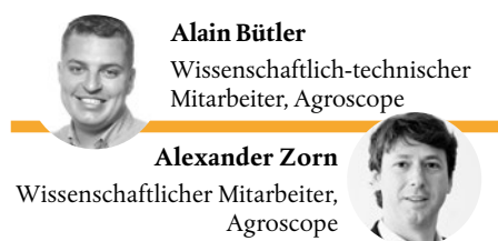
Alain Bütler Wissenschaftlich-technischer Mitarbeiter, Agroscope

Im Ressourcenprojekt PestiRed versuchen Schweizer Ackerbaubetriebe, den Einsatz von Pflanzenschutzmitteln