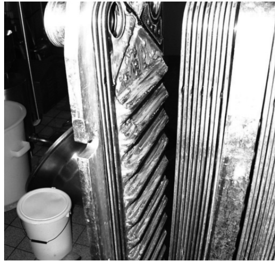
Plattenapparat Schmutz milchseitig

Jahrzehnte lange Erfahrungen der Käsereianlagebauer schliessen auch heute hygienische Schwachstellen bei Milch und Sirte berührenden Teilen nicht aus. Folgende Beispiele aus der Praxis sollen hier diskutiert und in Zukunft verhindert werden.