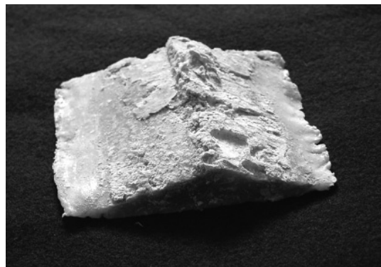
Rückstände aus selbstentschlammender Zentrifuge anlässlich Service